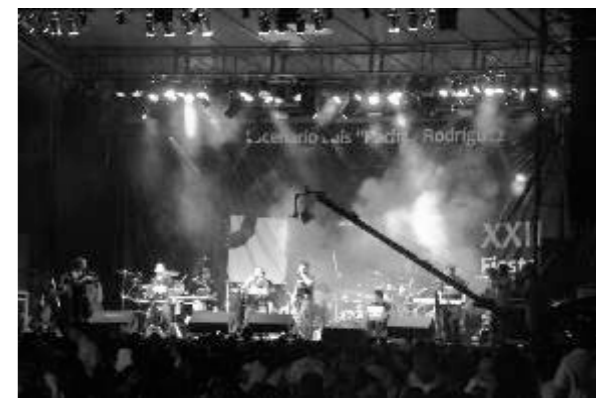
Populares. Los Príncipes, artífices de la cultura popular regional.