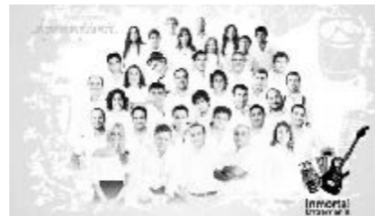
El disco. Portada de la obra que se divulgará.

importante se haya materializado y ahora pueda llegar a todos los lugares”, manifestó el gobernador Sergio Urribarrí en ocasión de la presentación del CD