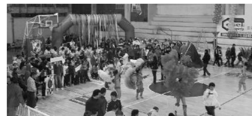
Sede. Jugaron en el club Salto Grande.

los departamentos de Villaguay, Colón, La Paz, Maciá y Chajarí, acompañadas por sus respectivos profesores de educación física. Durante los dos días, el camión sanitario, los agentes sanitarios y médicos comunitarios del Ministerio de Salud de Entre Ríos, realizarán controles médicos a los deportistas, brindando un mensaje de promoción de la salud y prevención de enfermedades.