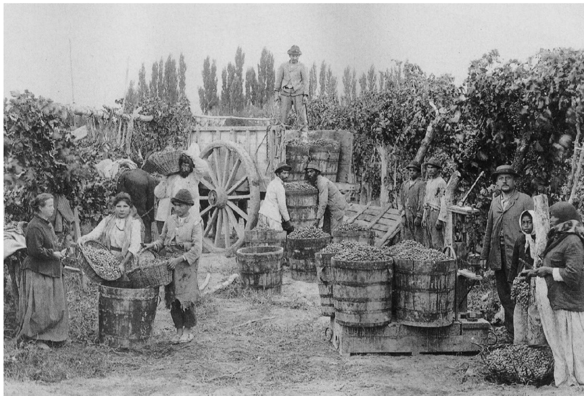
Hacia 1913, con sus crisis cíclicas, la vitivinicultura ya era la industria madre mendocina y daba trabajo a miles de personas. Eso fue exaltado en la primera y olvidada Fiesta de la Vendimia.

Debió pasar un tiempo para que la iniciativa se concretara. Del 5 al 13 de abril de 1913, Mendoza fue sede del Segun-