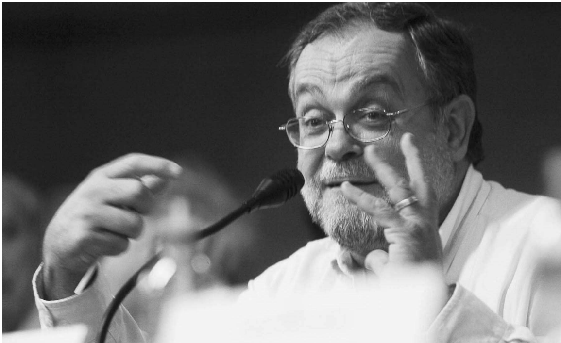
“Se ha restablecido la importancia de la lectura, pero falta mucho para que nos convirtamos en un país de lectores”, dijo el escritor.

¿Puede darnos algunos ejemplos de su Fundación que rompa con el escepticismo de quienes piensan que es una batalla perdida?