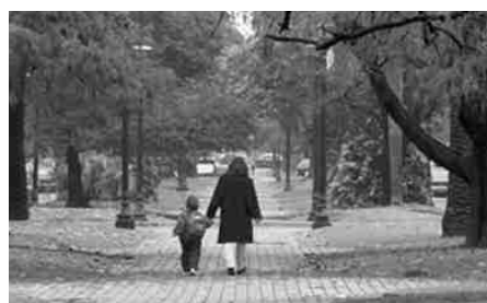
Un largo camino para ser reconocidos