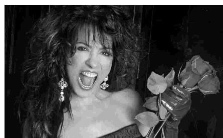
Patricia Sosa “me gusta cantar para todos”