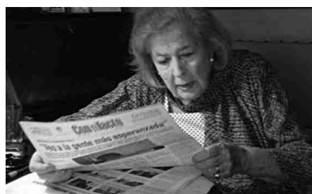
China Zorrilla, imperdible!