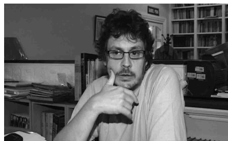
Felipe Pigna nos acerca a la Historia