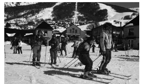
Miles de chicos visitan Bariloche cada año