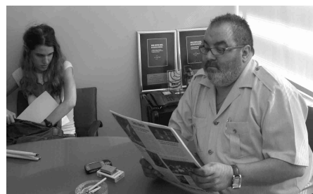
Jorge Lanata nos invita a reflexionar sobre ética